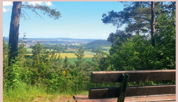
Blick Richtung Bad Neustadt und in die Rhön