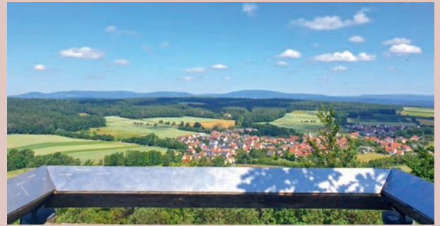
»Reichenbacher Blick« mit Aussichtsturm