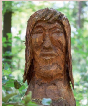
Freundliche Beobachter: Holzskulpturen am Wegesrand